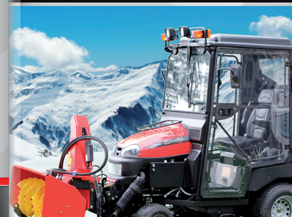
vyhřívaná kabina a sněhová fréza