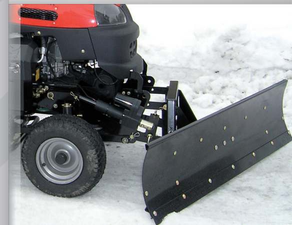
elektrický přední závěs a radlice 140 cm